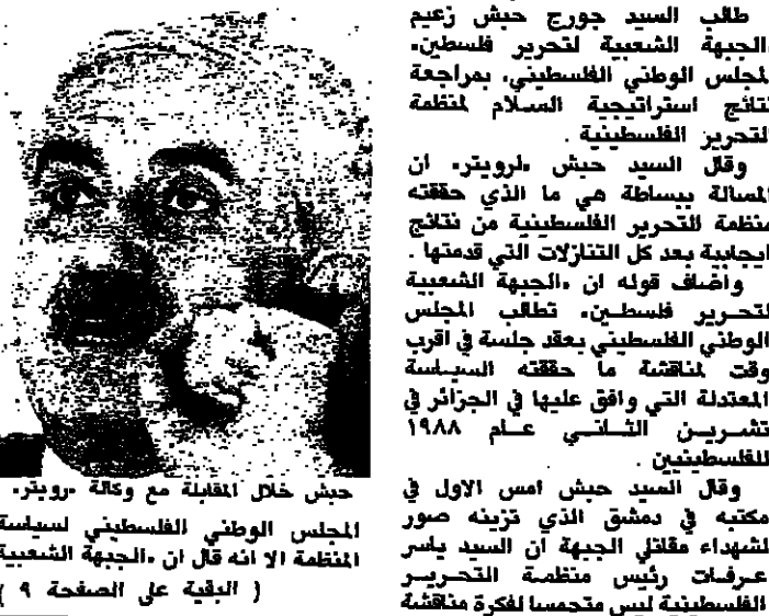
جيش خلال اللقاء مع وكالة رويترز، مكتبه في دمشق الذي تزينه صور لشهداء مقاتلي الجبهة ان السيد ياسر عرفات رئيس منظمة التحرير الفلسطينية ليس متحمساً لفكرة مناقشة

طلب السيد جورج جيش زعيم الجبهة الشعبية لتحرير فلسطين، المجلس الوطني الفلسطيني، بمراجعة نتائج استراتيجية السلام للمنظمة. وقال السيد جيش لرويت، ان المسألة ببساطة هي ما الذي حققته منظمة التحرير الفلسطينية من نتائج ايجابية بعد كل التنازلات التي قدمت. وأضاف قوله ان الجبهة الشعبية لتحرير فلسطين، تطالب المجلس الوطني الفلسطيني بتوقف جلسة في اقر وقت مناقشة ما حققته السياسة المعتدلة التي وافق عليها في الجزائر في تشرين الثاني 1988.